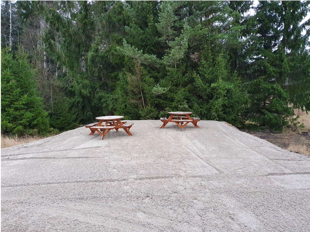
Skjutbanans nya fikaplats

I början på mars var det en nationell träff med länsinstruktörer på Öster Malma. Tyvärr var detta precis i samband av startern på pandemin och med det flera avbokningar med kort varsel. Först genomfördes under två dagar en ny utbildning för sju deltagare. När denna var färdig genomfördes en vidareutbildning där ytterligare tio länsinstruktörer anslöt. Praktiska övningar på skjutbanan och teoretiska genomgångar låg med på schemat. Utöver detta så fick samtliga prova att skjuta i en WR simulator och uppleva en intressant föreläsning om mörkerriktmedel.