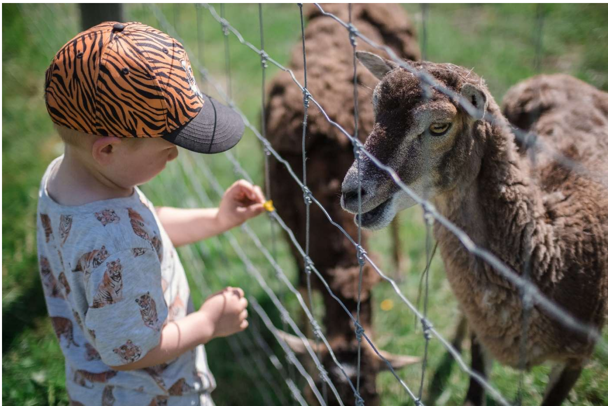
Barn och Mufflon i Wildlife Park

På grund av Covid-19 pandemin har nästan alla årets konferenser ställts in och därmed genomfördes betydligt färre guidningar i år jämfört med tidigare år. 13 grupper genomförde en bokad guidning under året. Antalet guidningar i Wildlife Park var 9 och på slottet tre samt en heldagsguidning.