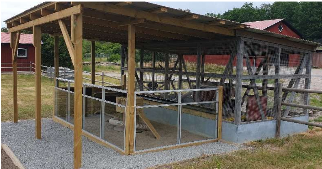
Nya visningsdelen för iller

Illrarna fortsätter att vara alla barns favorit. Illrarnas voljär har byggts ut med en visningsvänlig avdelning. Där vistas illrarna under dagen på högsäsongen. Deras bohåla i visningsdelen har en sida av plexiglas vilket gör det möjligt för besökarna att se illrarna även om de för tillfället vilar sig. Efter lite letande lyckades vi även få tag på två nya illervalpar av honkön så vi har nu tre stycken illrar.