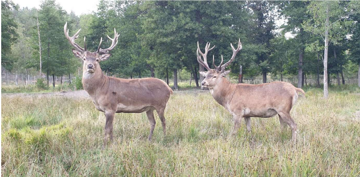
Kronhjortarna i visningshägnet