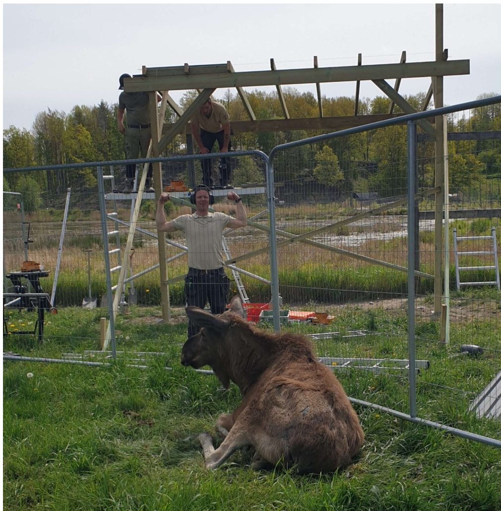
Grabbarna snickrar tak till älgarna

Med hjälp av Sörmlands Museum blev även takrenoveringen på Torpesta Kvarn klar.