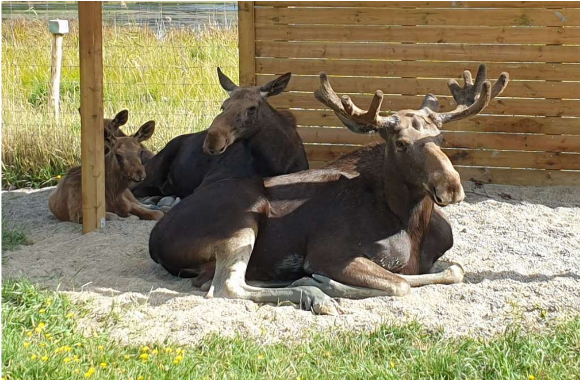
Älgarna njuter under sitt nya tak

verkade trivas att ligga där i alla väder. När älgarna ligger under taket kan de samtidigt betraktas på nära håll av besökare vilket är väldigt uppskattat.