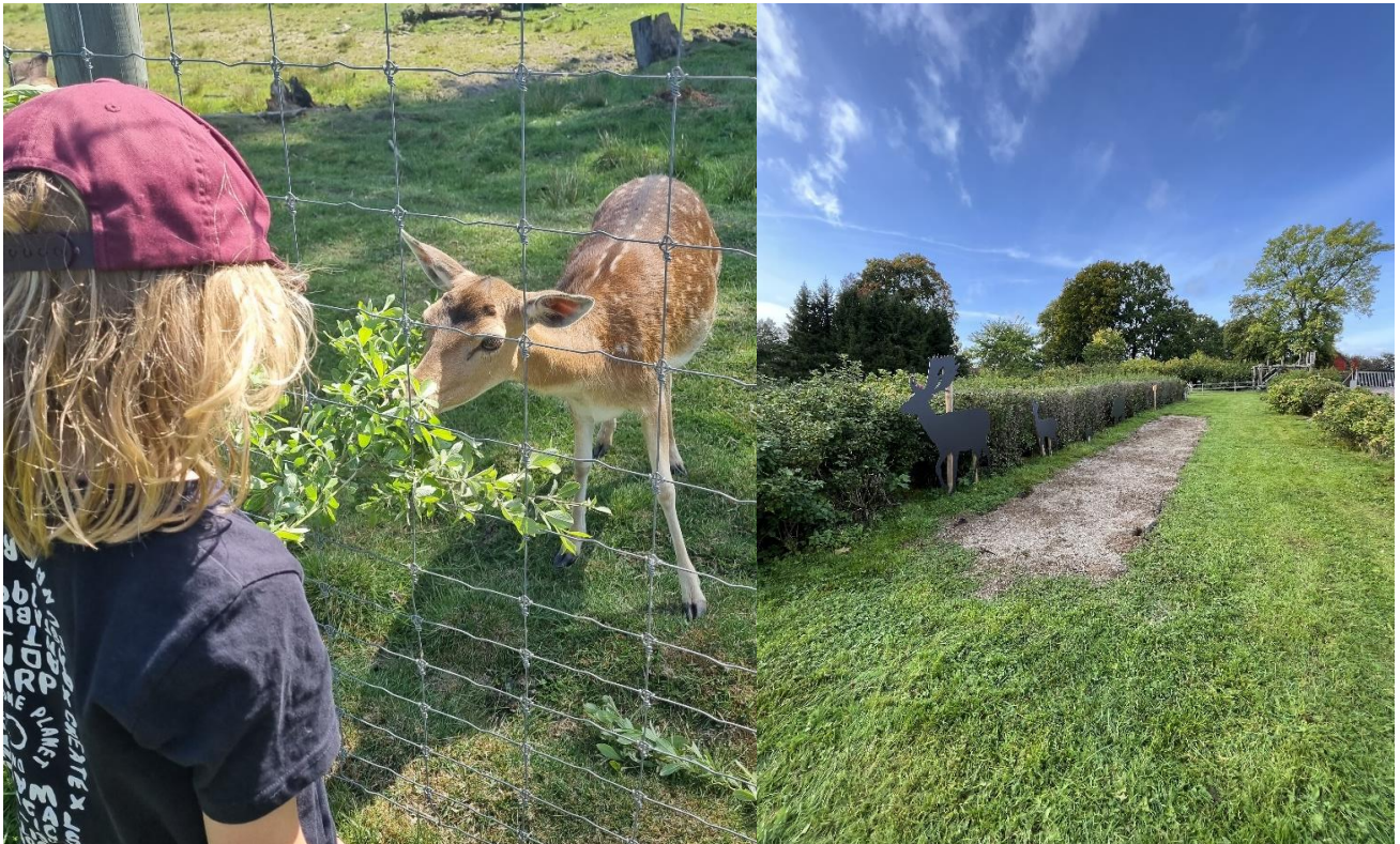
En kvist av salix lockar ofta djuren att komma nära besökarna och nya längdhoppbanan

I anslutning till vandringslederna har ett konstgjort rävgryt anlagts och horn hängts upp. En ekoxe i trä som tillverkades av Skogskonst AB har placerats vid ekarna bakom vildsvinshägnat. "Motorsågskonstnären" har även tillverkat en bergguv och en älg för visningsändamål.