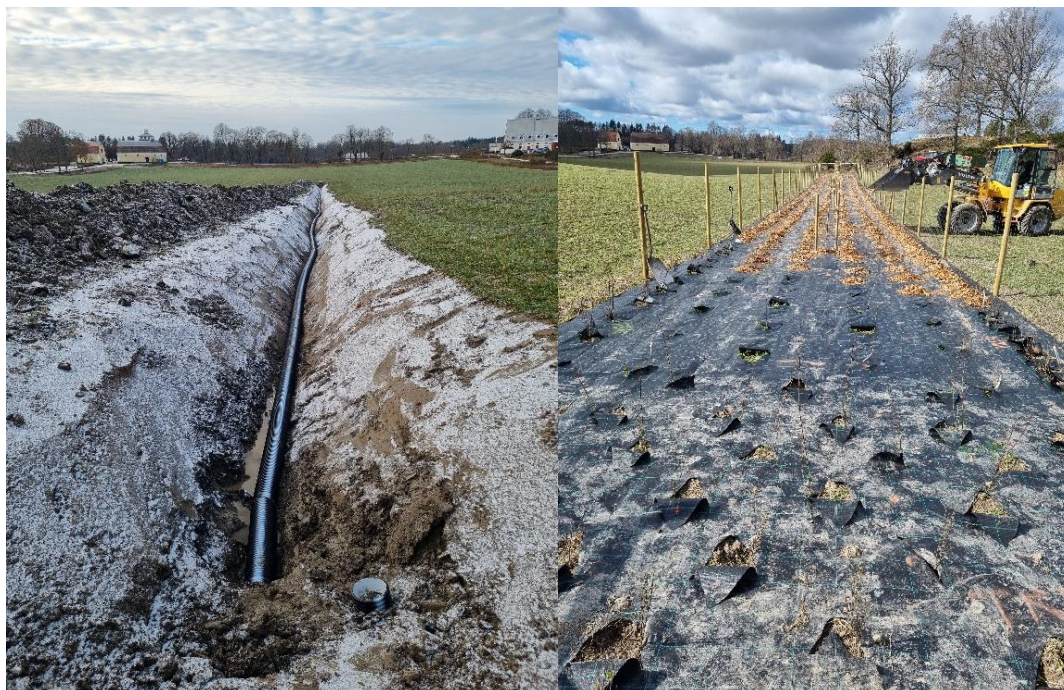
Nygrävd täckdikning och planteringshägn