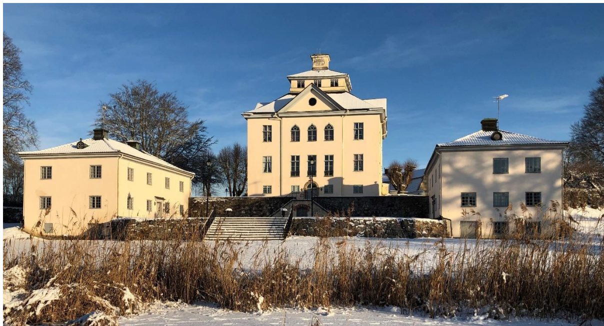
Öster Malma slott i vinterskrud

Jägareförbundet Service AB mål att generera ett ekonomiskt överskott och övriga enheters ekonomiska utfall värderas mot den årligt redovisade verksamheten.