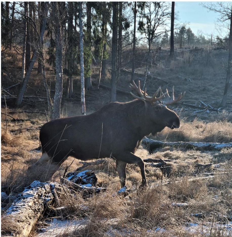
Älgtjuren Måns visar upp sig för besökarna i Wildlife Park

Under 2023 såg vi en markant minskning från året innan på antalet bokade grupper som även önskade en guidad tur. 24 grupper gick en förbokad guidad tur under året. 9 guidningar gick till slottet, 4 slott- och parkguidning samt 11 guidningar i Wildlife Park.