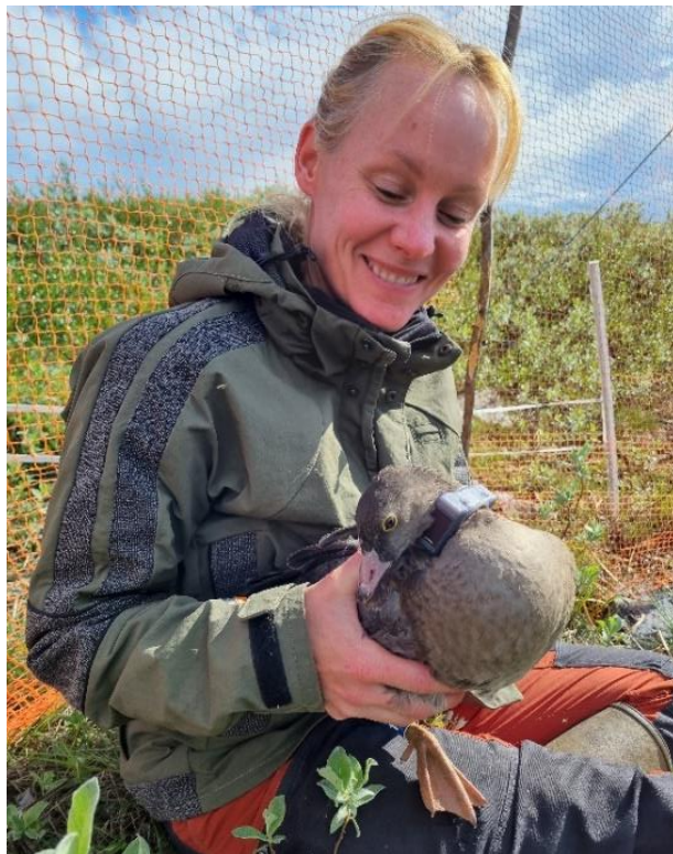
En ung GPS-försedd fjällgås kontrolleras av fältarbetare.

Ammarnäs är en värdefull rastplats för de svenska fjällgässen eftersom majoriteten av häckpopulationen använder denna plats som ett sista stopp innan flytten upp till häckningsområdet. Likt 2022 gjordes även 2023 en riktad inventeringsinsats här under maj månad för att få en uppskattning om populationens status inför häckningen. Resultatet visade att minst 72 fjällgäss passerade Ammarnäs under våren 2023 och 32 potentiella häckningspar kunde konstateras.