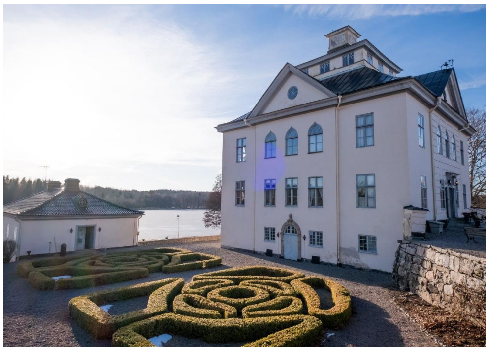
Den gamla buxbomslabyrinten utanför Öster Malma Slott

Gästmixen består av konferenser, privatmarknad samt närområdet som äter lunch och njuter av den goda maten i alla arrangemang vi erbjuder. Vi har under året haft stängt på måndagar förutom för konferenser.