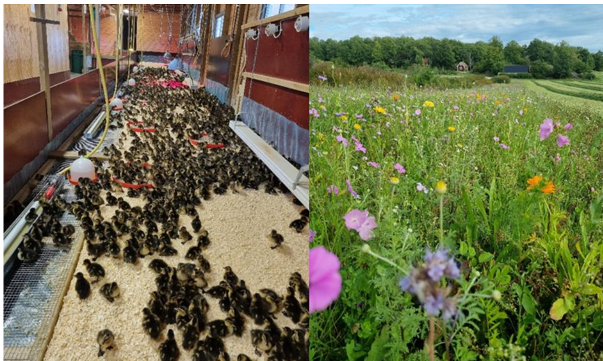
Gräsandsällingar i uppfödningsanläggningen och blomsterrensa

Anderiet har under hösten genomgått en smärre "skönhetsbehandling". Nytt innertak, samt isolering i tak och väggar.