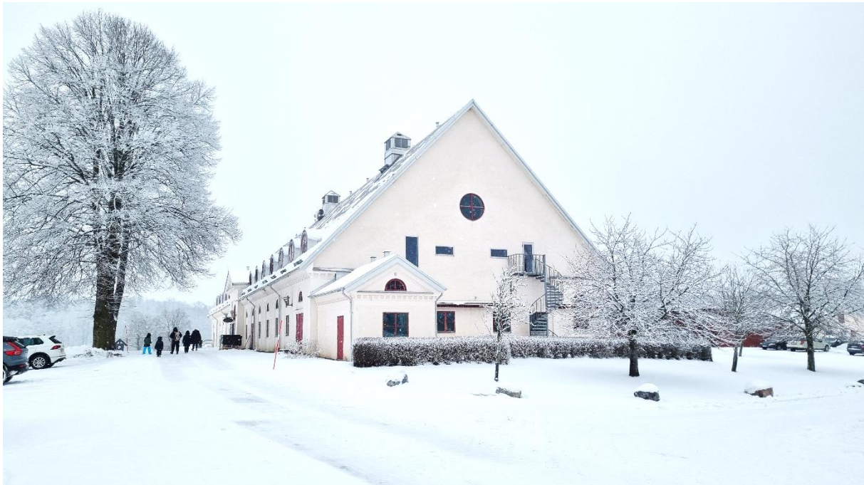
Laggårn i vinterskrud