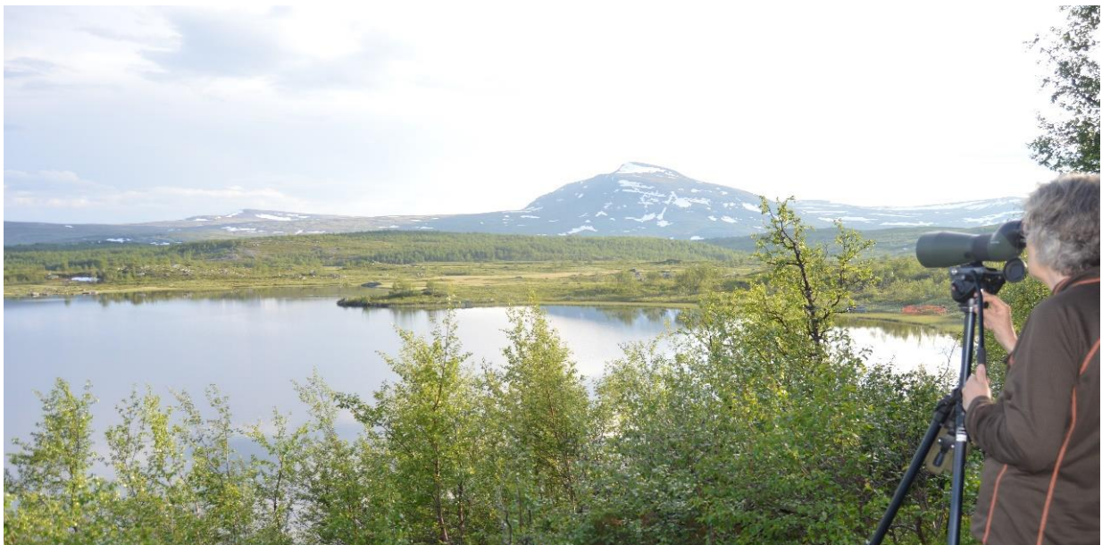
Fältdarbetare följer en grupp utsatta fjällgäss inne i viken. De visar sig ha slagit följe med tre vilda fjällgäsfamiljer redan dagen efter utsättningen.

Efter fjolårets dramatik då en fjällgåsunge blev tagen av en mink i häckningsområdet har nu Svenska Jägareförbundets grupp för förvaltning av invasiva främmande arter påbörjat arbetet med att bygga upp ett system med minkfällor i häckningsområdet.