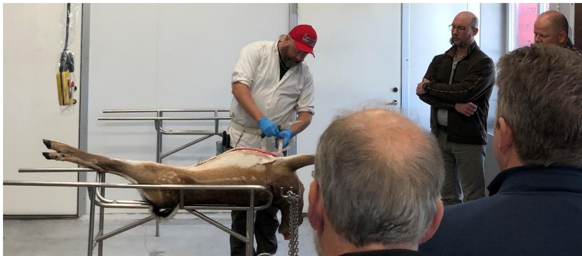
Undervisning i viltslakteriet