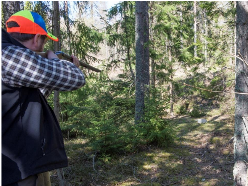
Övning ger färdighet

Antalet instruerade timmar på skjutbanan till privatkunder är ungefär likvärdigt med föregående år. Dock märks det att totala trycket med förfrågningar har minskat. Sannolikt kopplat till allmänna kostnadsläget. Framför allt är det under hösten när klövviltsjakten närmar sig som många vill få hjälp att utveckla sitt kulskytte. Under våren är det mer blandat med både kul- och hagelinstruktion.