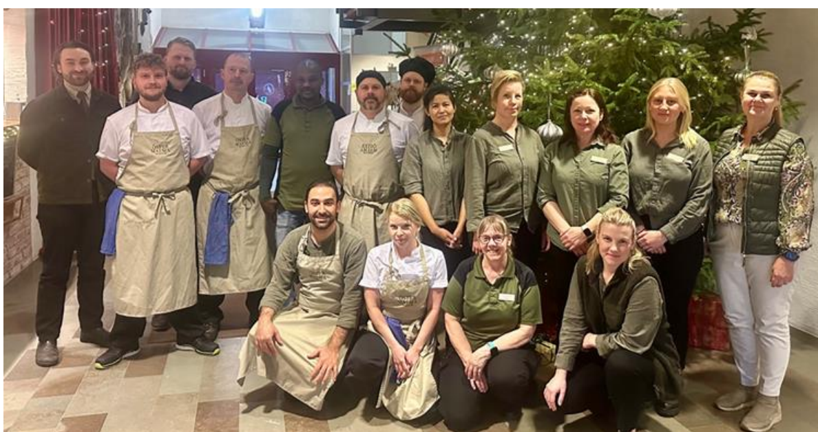
Personal på Jägareförbundet Service AB

Vid nyrekrytering sätter vi störst vikt vid att de vill arbeta på Öster Malma, steg 2 i vår organisation och steg 3 att personen har rätt kompetens och utbildning, annars lär vi ut "allt vi kan". Vi har haft ett flertal praktikanter från YH-utbildningar, universitet, gymnasier samt högskolan. Vår hotellchef slutade i oktober och hon ersattes inte utan vi fördelade ansvaret på befintlig personal samt har en marknadskonsult anlitad cirka 8h i veckan. Vi har låg personalomsättning och sjuktal, trivseln uppfattas som hög.