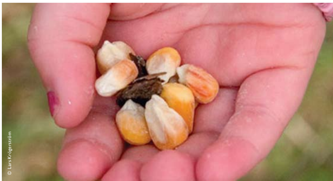
Bara oförädlade jordbruksprodukter används som foder. Och utfodringen sker sparsamt.

-Och i vissa andra områden, med liknande ägostruktur som vår, följer man vårt exempel med spännt intresse. Så det här kan vara början till något mycket större.